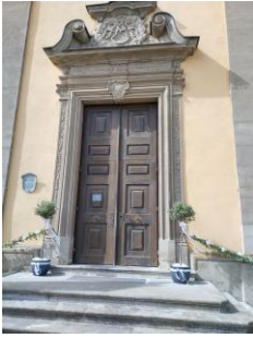
Pfarrkirche Großwenkheim