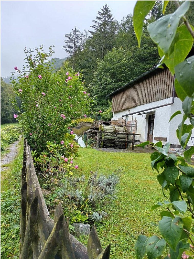
Mühlenweg – Nussdorf a. Inn

PG in Lauertal PG „Johannes Maria Vianney“ Münnerstadt mit Filialen